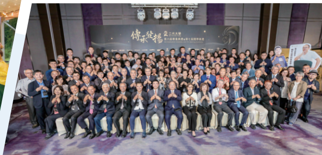
二代大學協助新一代創新與傳承