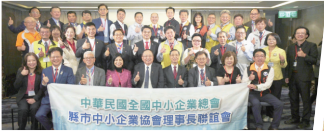
縣市中小企業協會理事長聯誼委員會