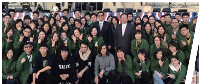
主辦元旦總統府升旗音樂會

中華民國全國中小企業總會多年來服務會員與產業交流，暢通中小企業發聲管道，每年辦理2,000多場次活動，如晉見總會和向行政院院長提建言、辦理元旦總統府升旗典禮、中小企業全國聯合新春團拜、山頂尾溜嘉年華會、各類獎項表揚(國家磐石獎、創新研究獎、新創事業獎、國家人才發展獎)、人才培訓輔導及法規調適等，協助國內中小企業發展。