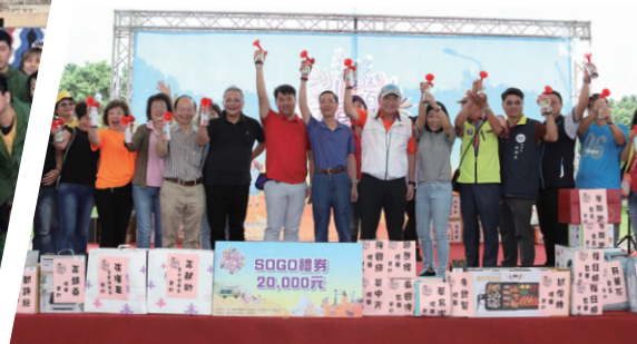
「山頂尾溜嘉年華會」活動花絮