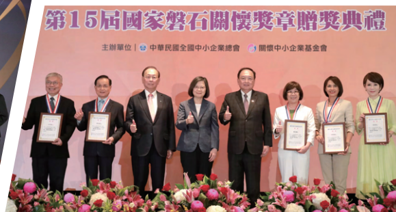
國家磐石關懷獎章贈獎典禮