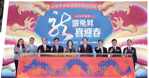
全國中小企業聯合新春團拜