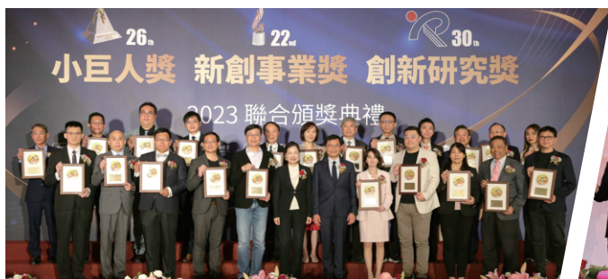
創新研究獎頒獎典禮