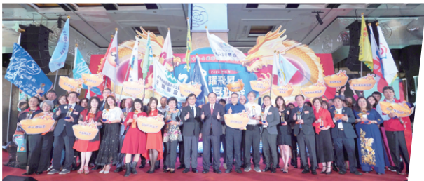
跨業交流聯誼委員會