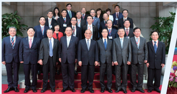
行政院蘇院長與本會理監事及關懷基金會董事合影