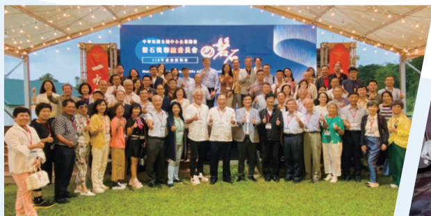
磐石獎聯誼委員會企業參訪活動