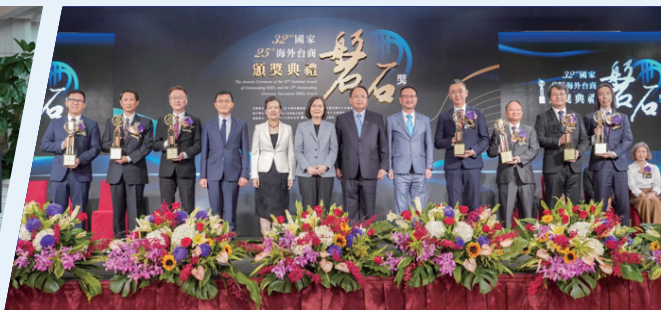
國家磐石獎(卓越中小企業)頒獎典禮